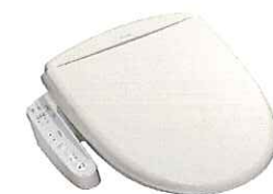
温水洗浄機能付き 暖房便座