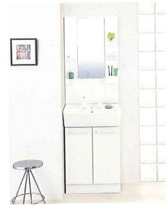
洗面化粧台 (ハンドシャワー付)