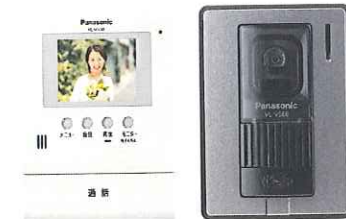
テレビドアフォン(録画機能付)