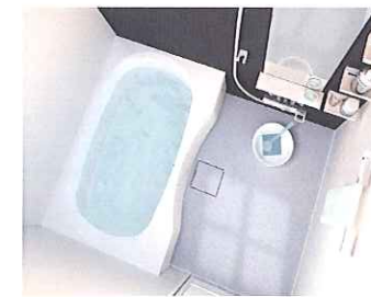
バス(ミラー・収納棚付)