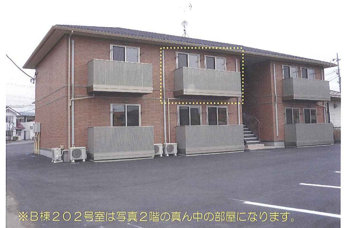
※B棟202号室は写真2階の真ん中の部屋になります。

2LDK プランはアルヴェアーレ K10A/K10B 1・2F共に同じ間取りとなります。