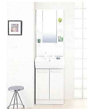
洗面化粧台 (ハンドシャワー付)