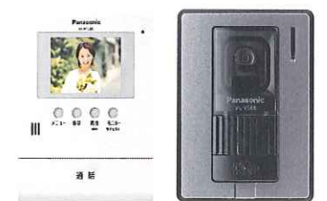
テレビアフォン (録画機能付)