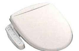
温水洗浄機能付き 暖房便座