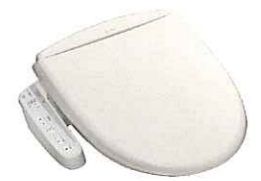
温水洗浄機能付き