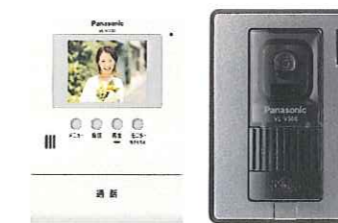
テレビドアホン (録画機能付)