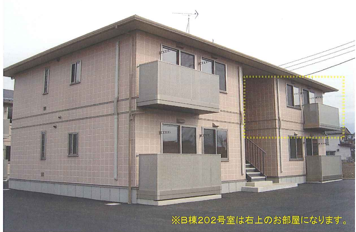
※B棟202号室は右上のお部屋になります。