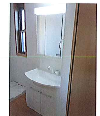
ハンドドライヤー付洗面台