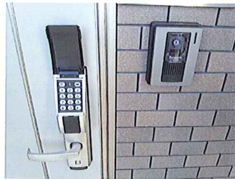
e dロックキー+テレビドアホン