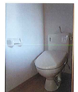
ウォシュレット付トイレ