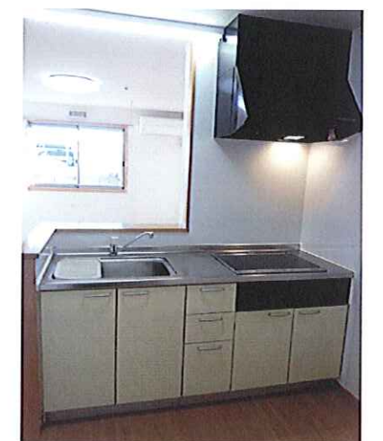
I Hクッキングヒーター付キッチン

人気の対面キッチンは IHクッキングヒーターです。 火を使わないから安全で 何といたっても掃除が楽!