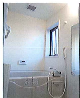
追い焚き機能付バス