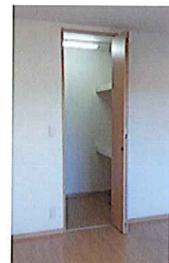
耐震ロック付玄関収納 棚付WIC