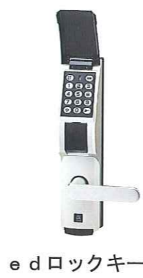
e d ロックキー