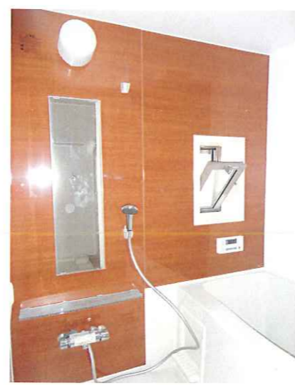
追焚・ロングミラー・収納付き