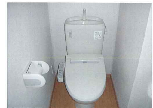
温水洗浄付暖房便座