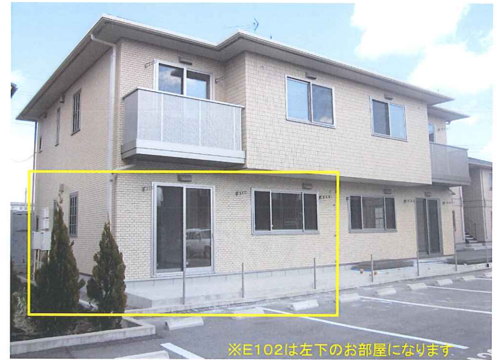
※E102は左下のお部屋になります