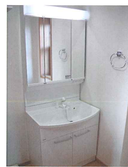
ハンドリジャワー付三面鏡トレッサー